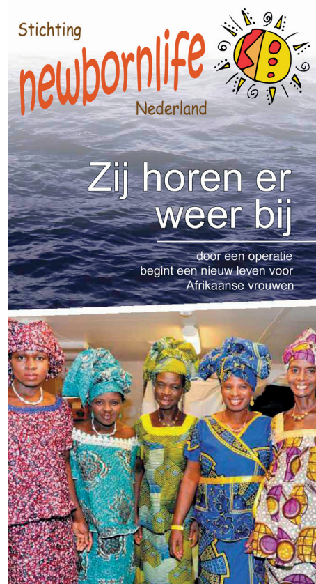
De voorkant van de nieuwe folder